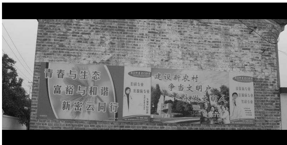
(affiche de gauche) La jeunesse et l'écologie, la richesse et l'harmonie accompagnent le développement du nouveau district de Miyun.

L'expression «Barong bachi», proposée en 2006 par Hu Jintao (premier secrétaire du Parti communiste chinois depuis 2002 et président de la République populaire de Chine depuis 2003), est devenue la nouvelle référence morale servant à juger le travail, la conduite et l'attitude des fonctionnaires du Parti communiste. En chinois, cette liste de huit motifs d'honneur et de huit motifs de honte se lit presque comme une poésie du fait des jeux de sonorités et du rythme binaire.